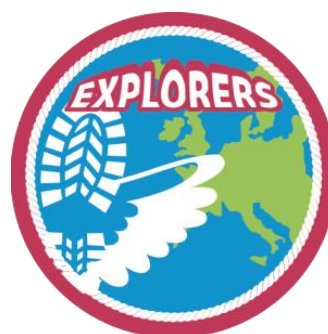
Art. nr. 61300