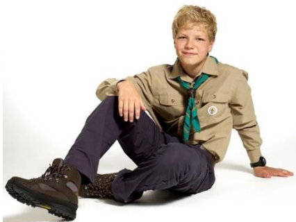
(Art. nr. 1114)