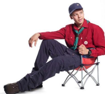
(Art. nr. 1216)