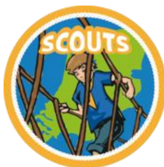
Art. nr. 61200