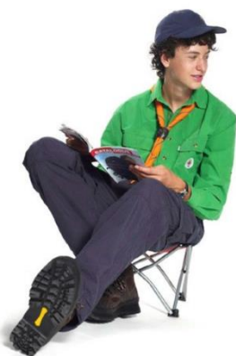
(Art. nr. 1012)