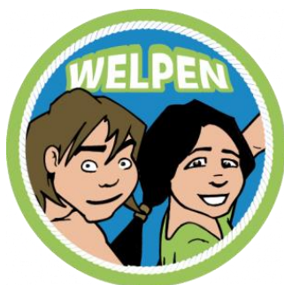
Art. nr. 61100