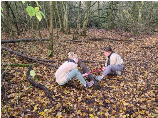
Groetjes van de scoutsleiding